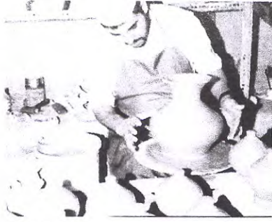
( صناعة الفخار ص ١١٠ )