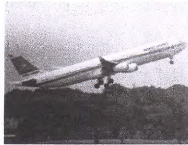
( النقل الجوي ص ١١٥ )