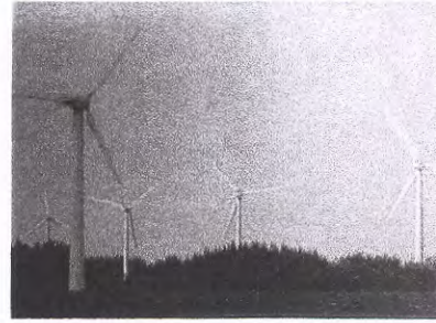
( طاقة الرياح ص ١٣٣ )