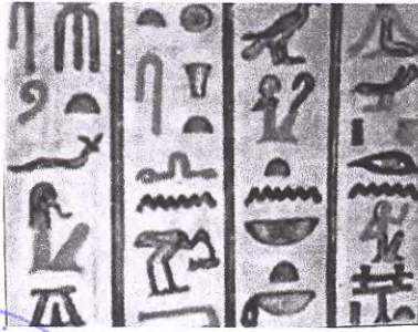
( الكتابة الهيروغليفية ص ٥٦ )